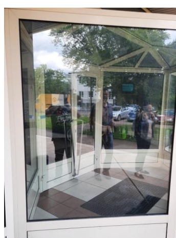
wys. 265 sz. 167