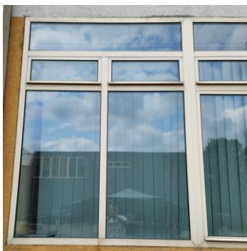
wys. 245 sz. 180 - antisol