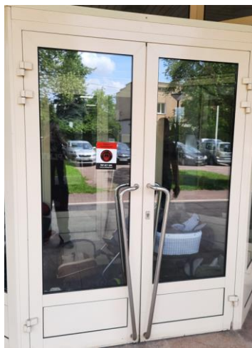
wys. 246 sz. 176