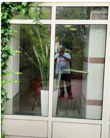
wys. 236 sz. 180