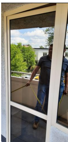
wys. 219 sz. 90