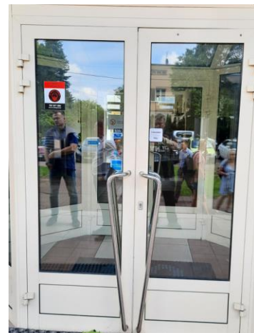
wys. 265 sz. 175