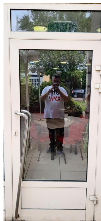
wys. 235 sz. 95