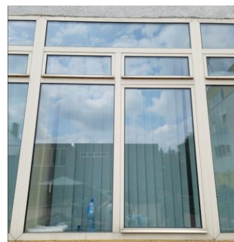
wys. 245 sz. 180 uchylne