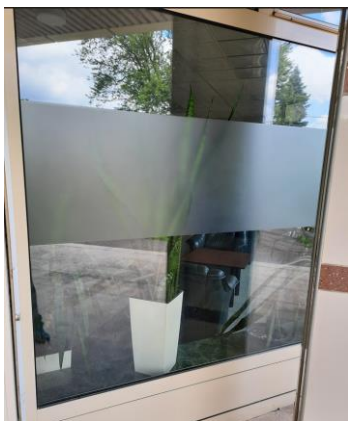
wys. 325 sz. 253