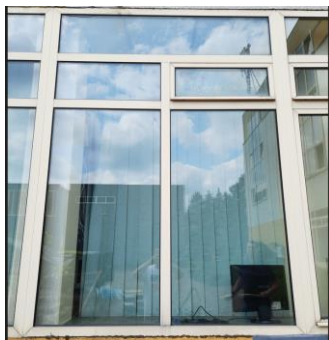
wys. 245 sz. 180