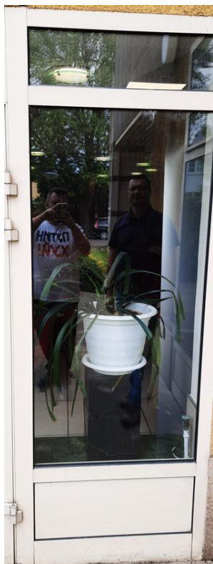
wys. 236 sz. 87