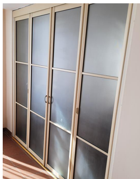
dł. 235 sz. 243