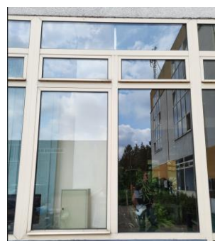
wys. 245 sz.180