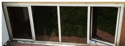
wys. 140 sz. 35