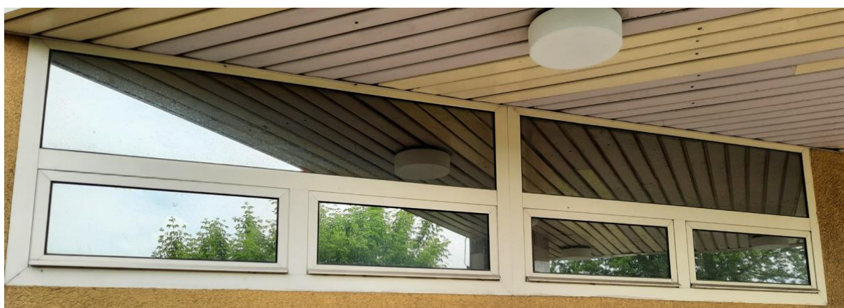
wys. 83 sz. 180 x 2