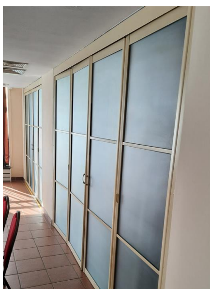
dł. 235 sz. 306