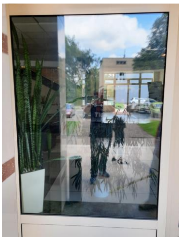
wys. 325 sz. 151