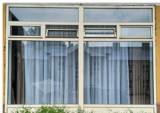
wys. 288 sz. 180 x 2