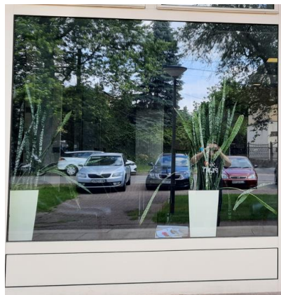
wys. 325 sz. 237 x 2