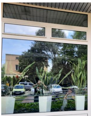
wys. 325 sz. 239 x 2