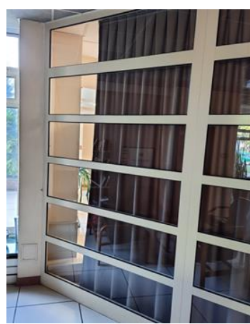
wys. 280 sz. 162