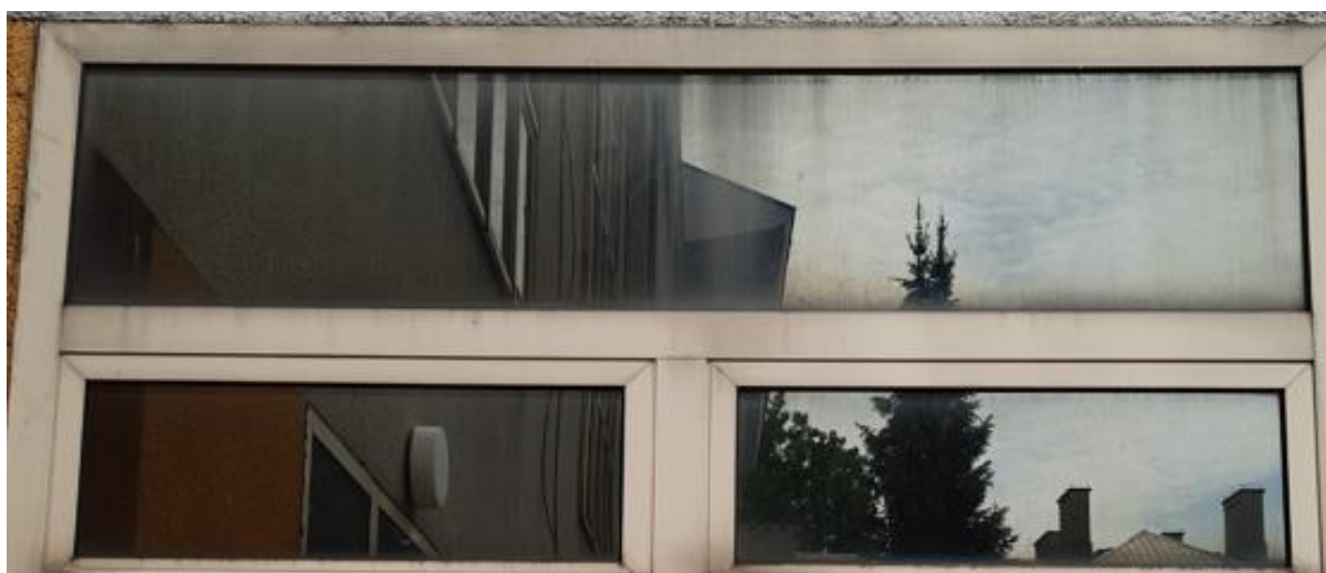
wys. 83 sz. 180