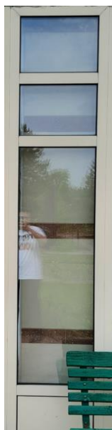
wys. 288 sz. 62