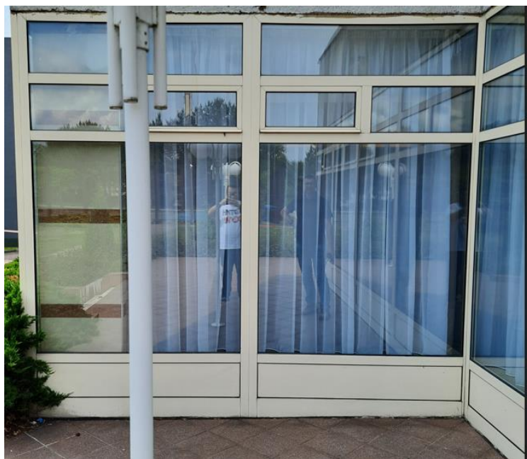
wys. 288 sz. 160 x 2