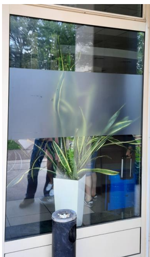
wys. 325 sz. 151