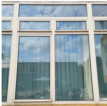
wys. 245 sz. 180 uchylne okno okno