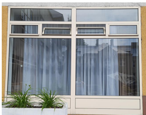
wys. 288 sz. 180 x 2