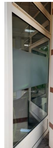
wys. 325 sz. 167,5