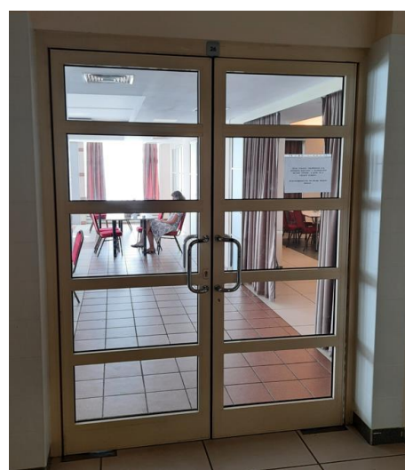
wys. 235 dł. 190