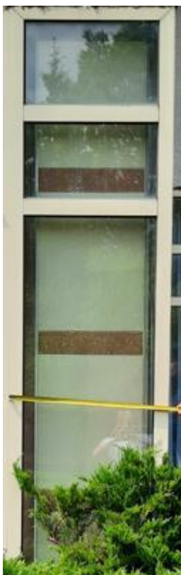
wys. 288 sz. 70