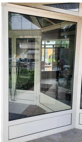
wys. 265 sz. 163