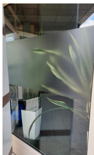
wys. 325 sz. 167