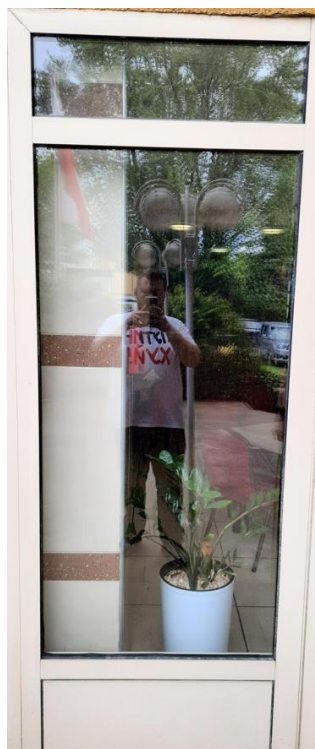
wys. 236 sz. 87