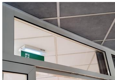
wys. 55 dł. 160