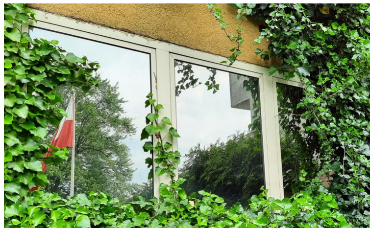
wys. 130 sz. 270