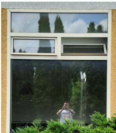
wys. 288 sz. 188