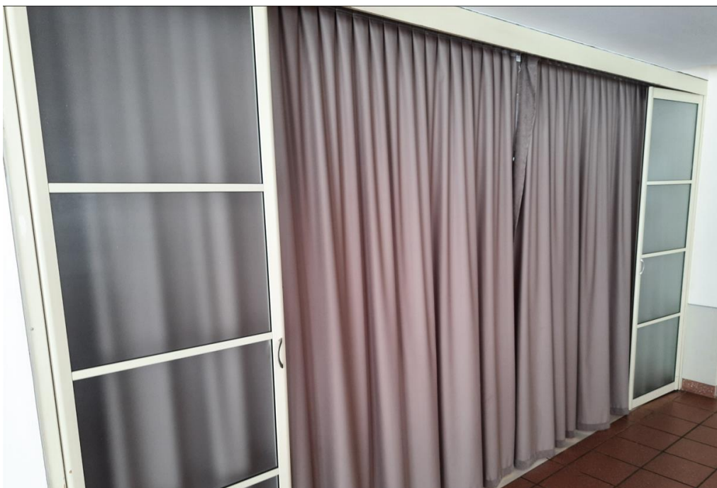
wys. 235 dł. 244