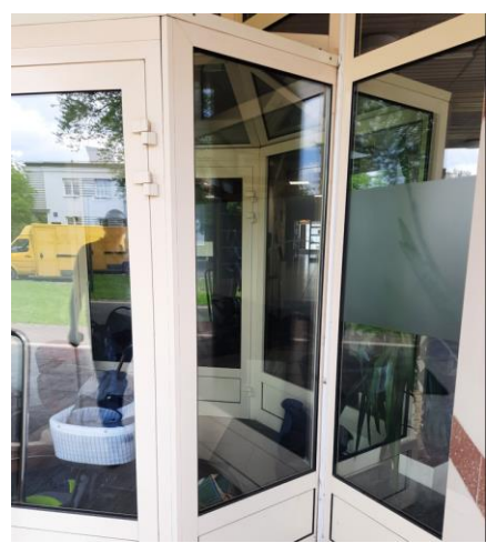
wys. 246 sz. 82