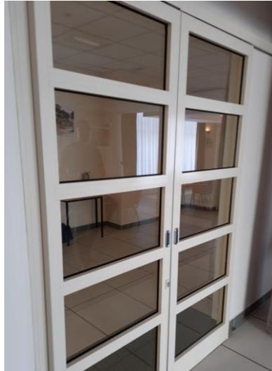
wys. 232 dł. 64