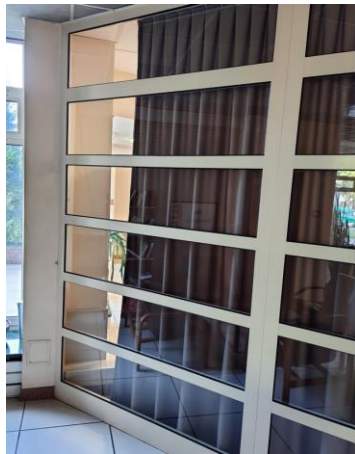
wys. 280 sz. 160