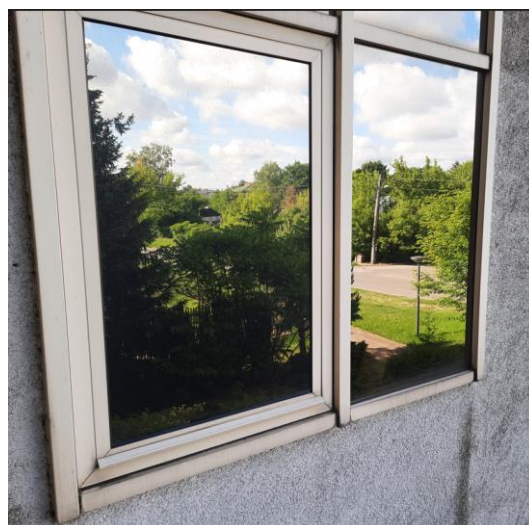
wys. 133 sz. 170 x 96