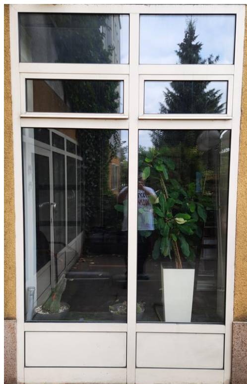
wys. 288 sz. 168