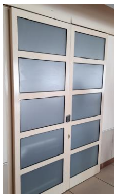
wys. 230 dł. 170