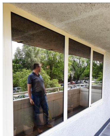
wys. 134 sz. 270