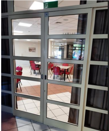
wys. 232 sz. 165 - automatyczne