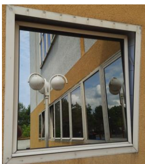
wys. 120 sz. 120