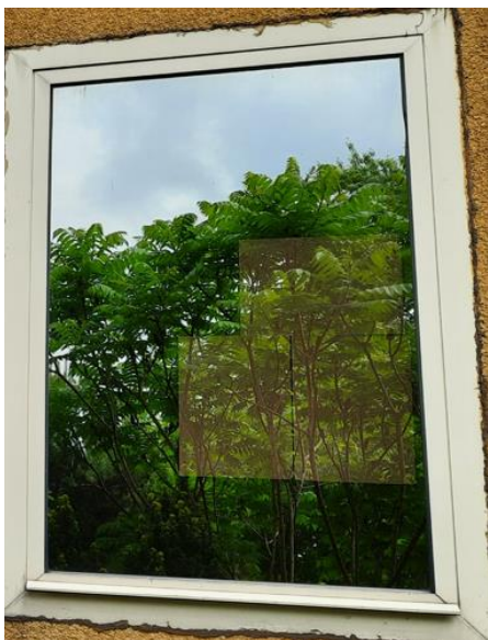
wys. 130 sz. 90 x 4