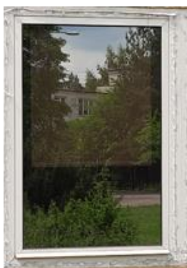
wys. 130 sz. 90 x 9