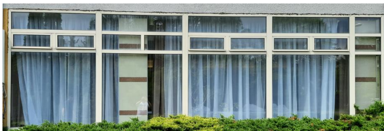
wys. 288 sz. 188 x 4