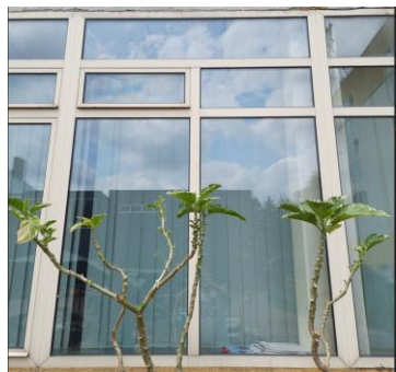
wys. 245 sz. 180