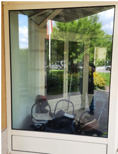
wys. 246 sz. 169