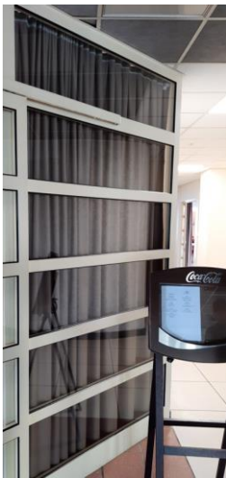
wys. 280 sz. 164