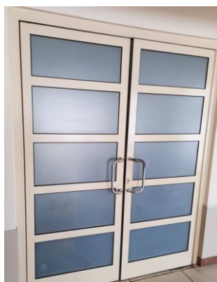
wys. 235 dł. 190