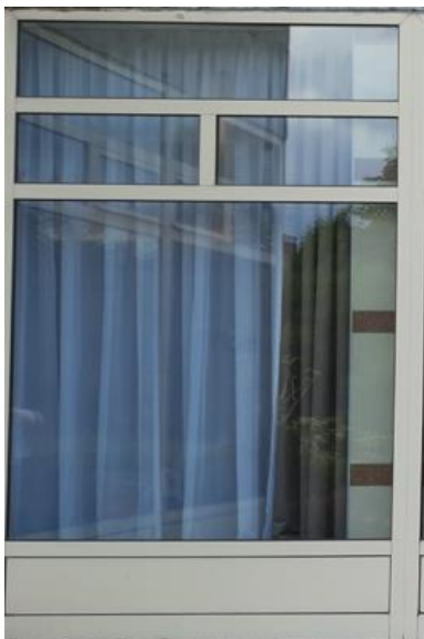
wys. 288 sz. 180 x 4