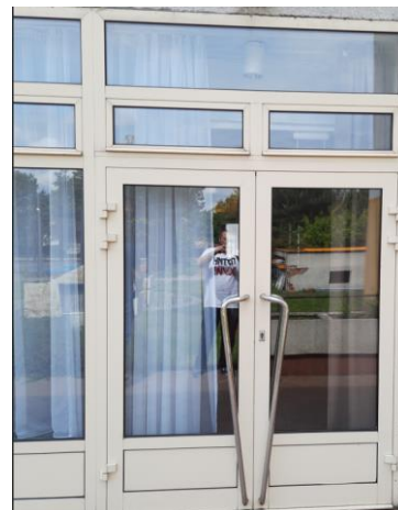
wys. 288 sz. 180